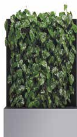
RAL 9006 aluminium blanc Protections RAL 7021 gris noir