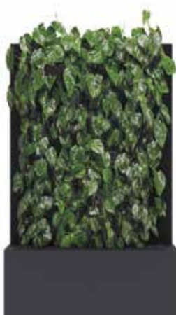
RAL 7016 gris anthracite