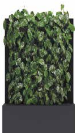
■ RAL 7016 gris anthracite